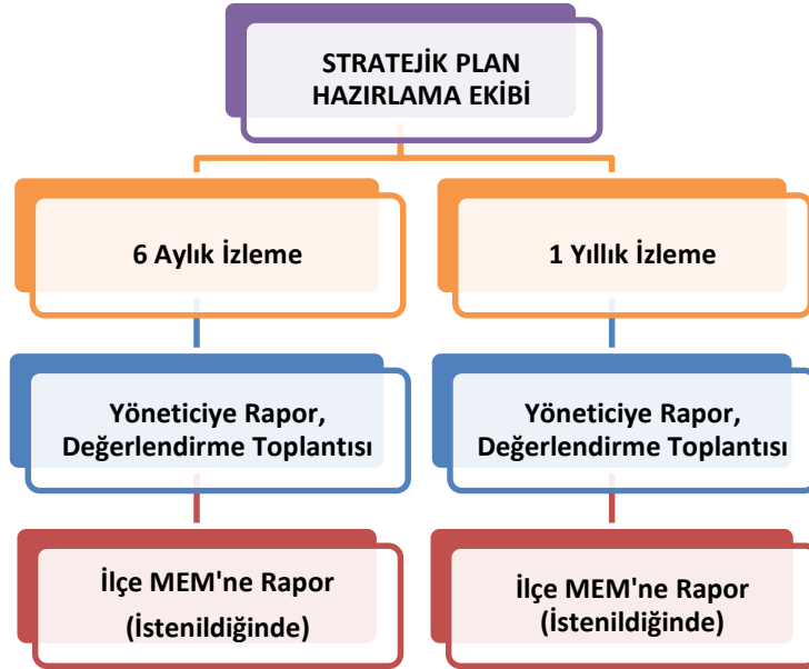
Şekil 2. İzleme ve Değerlendirme Süreci

Söke İmam Hatip Ortaokulu Müdürlüğümüzün 2019-2023 Stratejik Planı İzleme ve Değerlendirme sürecini ifade eden İzleme ve Değerlendirme Modeli hazırlanmıştır. Okulumuzun Stratejik Plan İzleme-Değerlendirme çalışmaları eğitim-öğretim yılı çalışma takvimi de dikkate alınarak 6 aylık ve 1 yıllık sürelerde gerçekleştirilecektir. 6 aylık sürelerde Okul Müdürüne rapor hazırlanacak ve değerlendirme toplantısı düzenlenecektir. İzleme-değerlendirme raporu, istenildiğinde İlçe Milli Eğitim Müdürlüğüne gönderilecektir.